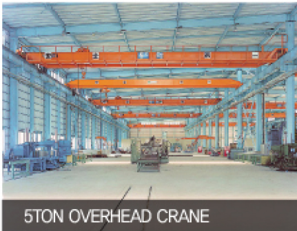
5TON OVERHEAD CRANE