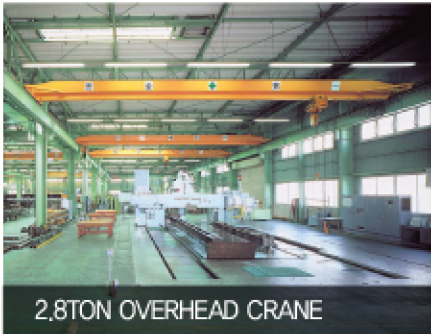
2.8TON OVERHEAD CRANE