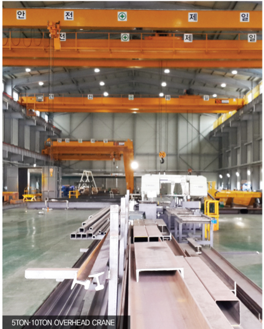
5TON·10TON OVERHEAD CRANE